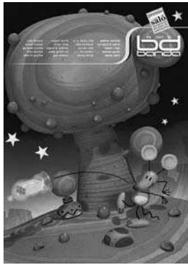
Portada de BD Banda nº6