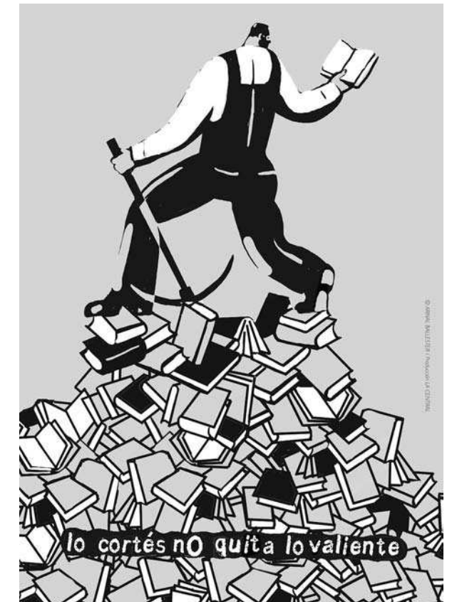
Esquerda: "Rusia tiene hambre" de Raúl. Arriba: Cartaz de Arnal Ballester