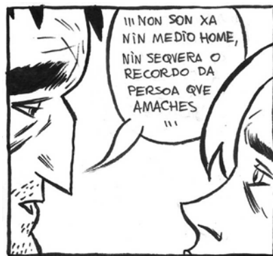
"Onde ningún pode chegar" de David Rubín

Máis que sentimental me considero sensible. Tento falar de sentimentos ou plasma-las miñas emocións nas historias que escribo e debuxo, pero non llechamaría "slice of life" ni nada po-lo estilo. Non lle chamaría "slice of life" ni nada po-lo estilo. Non conto a miña vida tal cual, nin o pretendo nin me interesa. Sí que falo de cousas que coñezo ou que vivín. Pero