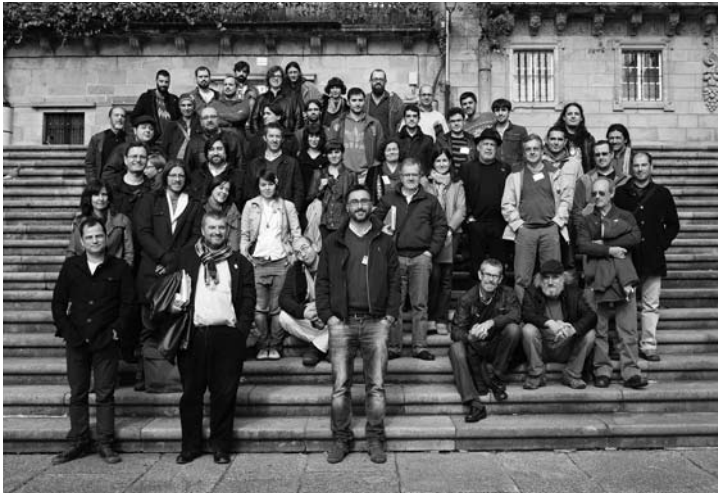
A «foto de familia» dos socios da AGPI asistentes ao Encontro de 2011, xunto con varios dos convidados. Como é tradicional, nas escaleiras da Quintana compostelá