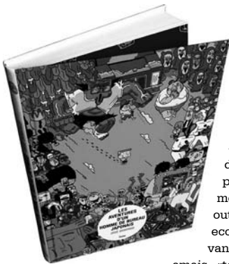
A edición francesa de 'Aventuras...'