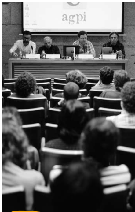
Presentación do Informe 2008 no VI Encontro de Ilustración

Encontro de Ilustración. A sexta edición do Encontro Galego de Ilustración, como de costume, decorreu no salón da Fundación Caixa Galicia de Santiago de Compostela, o derradeiro sábado de outubro de 2009. Contou nesta ocasión coa participación dos prestixiosos Max e Horacio Altuna como convidados especiais. Ambos ofreceron cadansúa interesantísima conferencia sobre os seus procesos creativos e traxectorias persoais —no caso de Max, apoiada nunha moi atinada proxección de traballos seus—, e despois participaron na mesa redonda que serviu para acompañar a presentación do Informe 2008 do Observatorio da Ilustración Gráfica, dado tamén o seu papel como presidentes de