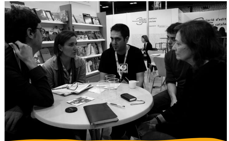
Reunión de representantes de asociacións profesionais en Boloña

Boloña. Outra vertente da nosa participación en feiras é a do panorama internacional. Aínda que nalgunha ocasión a AGPI tamén se ten ocupado de xestionar postos institucionais, como ocorreu outros anos no Festival de Angulema, o maior peso da actividade neste campo está na promoción do traballo dos asociados nos mercados internacionais, a través da difusión de catálogos co contacto persoal con axentes e editores