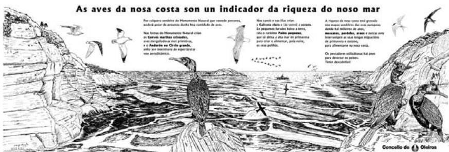
Ilustración: Enrique Mingote